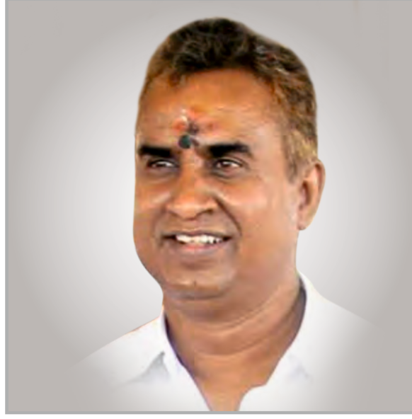
திரு. எஸ்.பி. வேலுமணி M.A., M.Phil., மாண்புமிகு நகராட்சி நிர்வாகம் மற்றும் ஊரக வளர்ச்சித் துறை சிறப்பு திட்ட செயலாக்கத்துறை அமைச்சர்