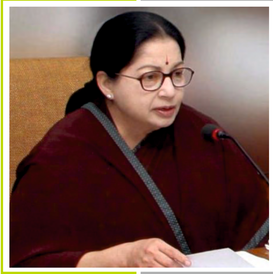
மாண்புமிகு புரட்சித் தலைவி அம்மா அவர்கள்